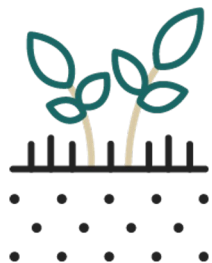
Takarónövényzet optimális használata