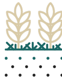
Növényi maradványok optimális kezelése