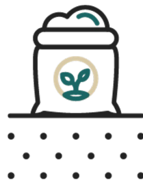
Szerves trágya használata