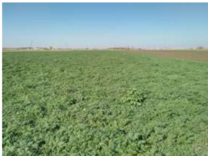
1. ábra A rozs és facélia jó kelést követően kiváló gyomelnyomó képességgel rendelkezik

60 napos területen tartás: Az ide vonatkozó rendelet szerint 60 napnál hamarabb nem lehetséges a zöldtrágyák beforgatása. A rendelet célja, hogy a zöldtárgya kifejtsse hatását, emellett betöltse a biodiverzitás növelésében neki szánt szerepet. Kiemelkedő igyelmet kell fordítani a komponensek érésidejére is, nem szabad, hogy az adott növény magot érleljen (árvakelés). A 60 napos határidő betartása, a keverékek előnyeinek ma imális kihasználása valamint a mag érlelés megakadályozása (1. kép) gyakorlati megvalósíthatóság szempontjából, igen nehéz feladat a termelőknek.