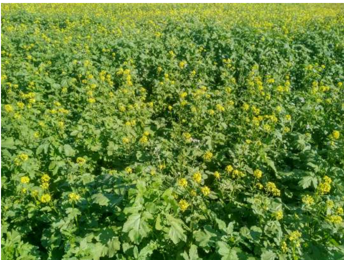
2. KÉP: Mustár túlsúlyos keresztet keverék

Hátrányai közt megemlítenél, hogy a repcét termelő gazdaságok a vetésciklusba nehezen tudják beilleszteni. A repce áttelelő, az olajretek és mustár pedig enyhe teleken teljes mértékben nem fagy ki, így a következő vetésekben okozhatnak növényvédelmi problémákat, amennyiben nem körültekintően alkalmazzuk. A nyári vetéseknél a kelés során érzékeny a bolha kártételre, amely akár teljesen megsemmisítheti az állományt (növényvédőszer-használati tilalom). A mélyre hatoló gyökérzet jelentős mennyiségű vizet használ fel a talajból, amely a következő kultúrára is kihatással lehet csapadékszegély körülmények között. Megfelelő technológiával őszi kalászos és kukorica előveteményeként ajánlott. (2. kép)