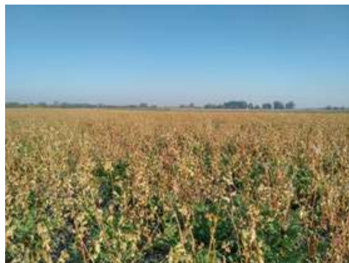
2. ábra A pohánka magot érlelt, ami a következő években árvakelésként lesz jelen

Vetési idő: A nem megfelelő időben történő vetés, súlyos következményekkel járhat. Ha nem időben történik meg a vetés, nem lesz megfelelő a kelés. További komoly problémát jelenthet, hogy a másodvetés komponensei, gyomnövényként jelenhetnek meg az elkövetkezendő években. Ennek a kezelése plusz ráfordítást és oda igyelmet igényel.