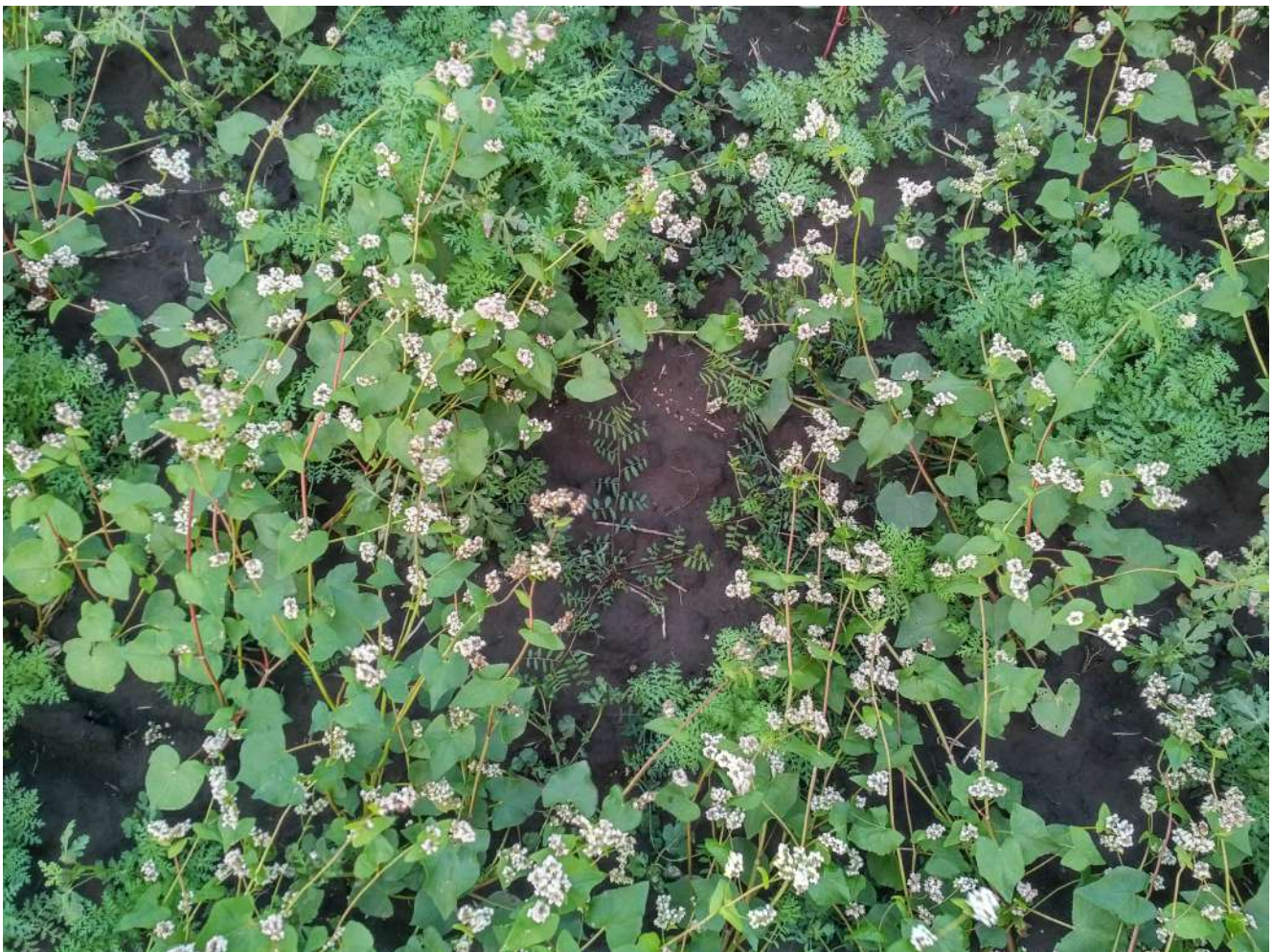
3. KÉP: Pohánka, facélia, bükköny keverék

Ezen zöldtrágya keverékekről általánosságban elmondható, hogy javítják a talaj víz-, hő-, és levegőháztartását. A sekélyen elhelyezkedő gyökérzet nem használ fel nagy mennyiségű vizet a talaj mélyebb rétegeiből, így vízmegőrzőbb más keverékeknél. Pillangós komponens esetén számolni lehet a légköri nitrogén megkötéssel is. Hatékonyan véd az erózió és defláció ellen is. Gyors kelésüknek köszönhetően jó gyomelnyomó képességgel rendelkeznek. A fajok eltérő virágzása miatt méhlegelőként is kiválóan alkalmazhatóak. Hátrányukra írható, hogy csekélyebb zöldtömeg mennyiség létrehozására képesek. Nincs mélyreható, talajlazító hatásuk. A pohánka és a facélia a legtöbb termesztett kultúrának kiváló elővetemény, a további komponensek (pillangós vagy kereszttes) határozza meg a utóvetemény korlátozásokat. (3.kép)