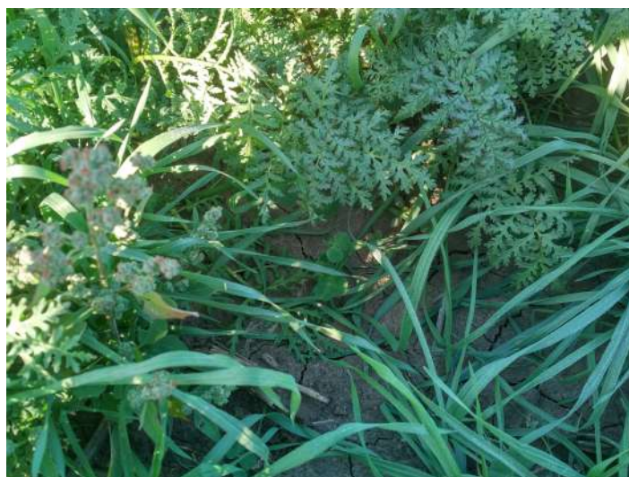
1. KÉP: Facélia, roz, bíborhere keverék

Meghatározó fajok a kalászosok, amelyek gyökérzete nem hatol mélyre a talajban, így nem szárítja ki a mélyebb talajrétegeket. A kártevőkre kevésbé érzékenyek, így biztonságosabb kelés érhető el. Az áttelelő fajoknak köszönhetően késő nyári vagy őszi vetéseket is jól tolerálják. A fajok döntő hányada zöldtakarmányként is hasznosítható, amelynek köszönhetően felértékelődik az állattartó gazdaságok számára. Csekélyebb zöldtömeget hoz, mint más keverékek, így a talajba dolgozása akár egy menetben is történhet. A legkedvezőbb áru keverékek ebbe a csoportba tartoznak. A hátrányai közé sorolható, hogy zöldtömeg hozama kevesebb, mint más keverékeknek, valamint csekély hatással van a talajszerkezet mélyebb rétegeire. A kukorica és napraforgó előveteményeként jól beilleszthető. (1. kép)