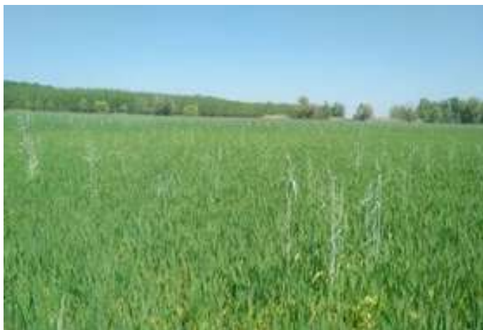
3. ábra Az őszi búza előtt rozs és olajretekkel zöldített tábla

Beforgatás: A nagy zöldtömeeggel rendelkező keverékeket egy menetben nem lehet jó minőségben talajba dolgozni. Ezen keverékek így módon történő bedolgozása rontja a talajmunka és a következő kultúra vetésének a minőségét.