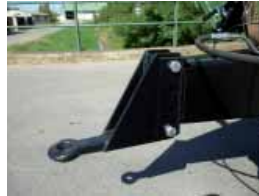
8) Serienmäßig höhenverstellbare Zugöse