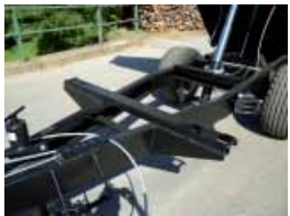
4) Extrem verwindungssteifer Stahlpressprofilrahmen