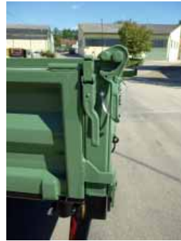
7) Verstärkte und geteilte Ecksteher aus massivem Rechteckrohr