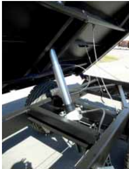
2) Hartverchromter überdimensionierter Kippzylinder mit automatischem Hubbegrenzungsventil in kardanischer Lagerung