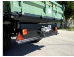
6) Gekanteter Unterfahrerschutz , geschützte Anbringung der Lichtanlage