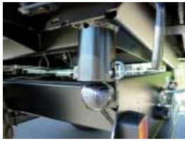
1) Massive verschleißfreie Kugelkipplagerung hinten