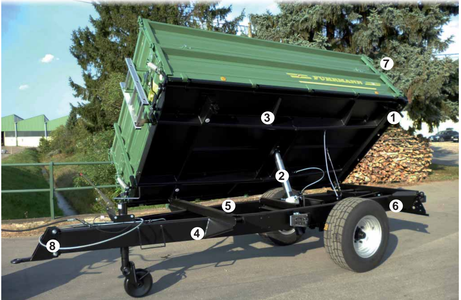
5) Stabiler Querträger mit seitlichen Lagerungen