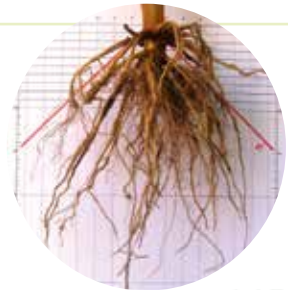
ES SENSOR ROOTS POWER Erősítő gyökérzet - Magasabb termés